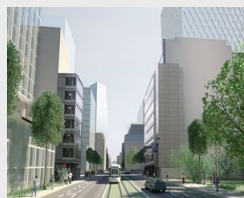
und vielleicht in Zukunft ...