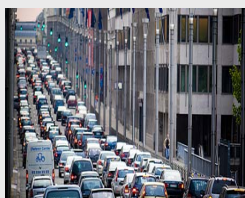
Die Rue de la Loi heute ...

Das Bundesverfassungsgericht in Karlsruhe wird am 30. Juni das Urteil zur Vereinbarkeit des Reformvertrags von Lissabon mit dem Grundgesetz verkünden. Es ist Voraussetzung für die Ratifizierung in Deutschland. Weiter hat der tschechische Senat dem Lissabon-Vertrag zugestimmt; aber: Präsident Klaus kündigte an, seine Unterschrift zu verweigern. Positive Signale gibt es von der „Grünen Insel“: Irlands Premier hat ein zweites Referendum für Anfang Oktober angekündigt.