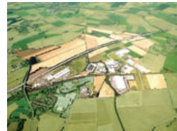
Gewerbpark Hohenlohe an der A 6

Insgesamt ist die Wirtschaftsstruktur des Landkreises von florierenden, mittelständischen Unternehmen geprägt, die auf die Anforderungen des Marktes flexibel reagieren können.