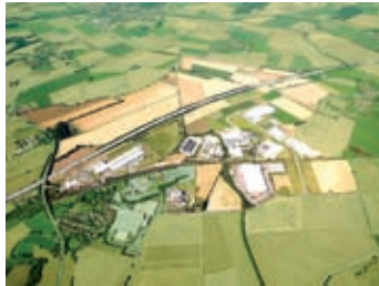
Gewerbepark Hohenlohe an der A 6

Insgesamt ist die Wirtschaftsstruktur des Landkreises von florierenden, mittelständischen Unternehmen geprägt, die auf die Anforderungen des Marktes flexibel reagieren können.