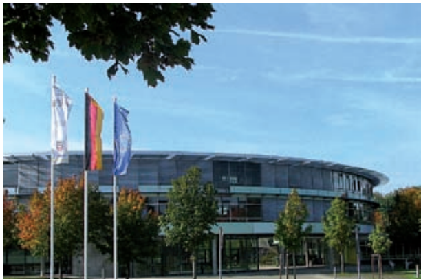
Kaufmännische Schule Öhringen

Der Hohenlohekreis hat die Berufsschulzentren an den Standorten Künzelsau und Öhringen kontinuierlich auf- und ausgebaut und mit modernster Technik ausgestattet. Hier können Berufsschulen für gewerbliche, kaufmännische, land- und hauswirtschaftliche Ausbildungsgänge in Vollzeit oder bei Eintritt in ein Ausbildungsverhältnis in Teilzeit besucht werden.