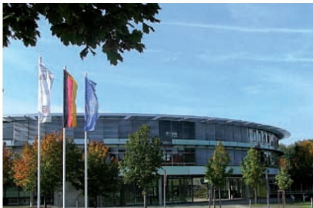
Kaufmännische Schule Öhringen

Der Hohenlohekreis hat die Berufsschulzentren an den Standorten Künzelsau und Öhringen kontinuierlich auf- und ausgebaut und mit modernster Technik ausgestattet. Hier können Berufsschulen für gewerbliche, kaufmännische, land- und hauswirtschaftliche Ausbildungsgänge in Vollzeit oder bei Eintritt in ein Ausbildungsverhältnis in Teilzeit besucht werden.