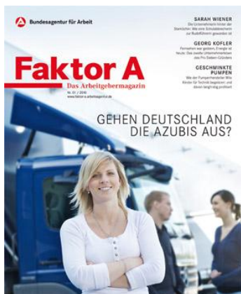
Das neue Kundenmagazin "Faktor A".