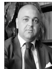
I. La Candia

Pirola Pennuto Zei & Associati studio di consulenza tributaria e legale