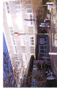
Technologie- und Gründerzentrum Tauberbischofsheim