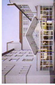
Mittelstandszentrum Tauber-Franken in Bad Mergentheim

Der Firmenausbildungsverband „fabi“ ergänzt das breite Angebot der drei Berufs- und Berufsfachschulzentren sowie unterschiedlicher Bildungs- und Ausbildungseinrichtungen, wie beispielsweise des Umschulungs- und Fortbildungszentrums e.V. in Niederstetten. Darüber hinaus ist mit der Außenstelle des Fraunhofer-Instituts für Siliciumforschung in Wertheim und einem Transferzentrum der Steinbeis-Stiftung und dem Know-How-Transfer zwischen Wirtschaft und Wissenschaft gewährleistet.