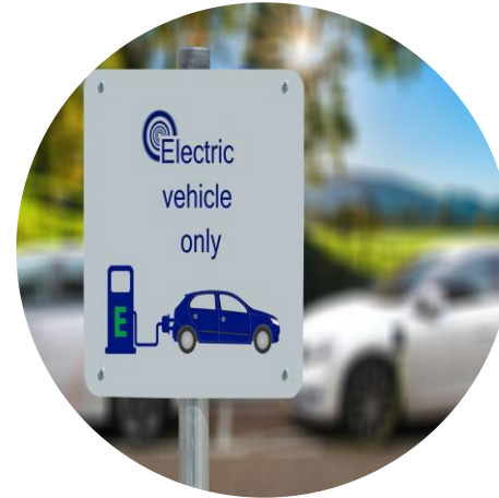
Nachhaltige Mobilität und Energie