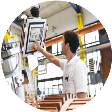
Transformation und Qualifizierung in der Produktion